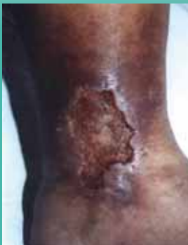
Zustand vor Behandlung mit Ligasano®