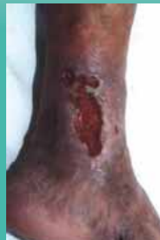
Zustand nach 5-wöchiger Behandlung mit Ligasano®