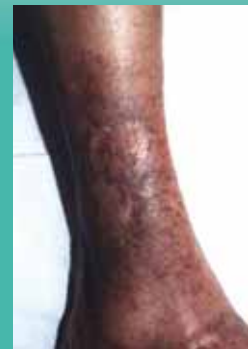
Nach 2-monatiger Behandlung mit Ligasano® ist die Wunde komplett abgeheilt.

Weitere eindrucksvolle Erfahrungsberichte: www.ligasano.com