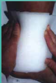
Behandlung mit Ligasano® Wundverband